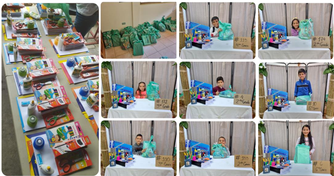
Uitgifte schoolbenodigdheden aan het begin van schooljaar 2023-2024